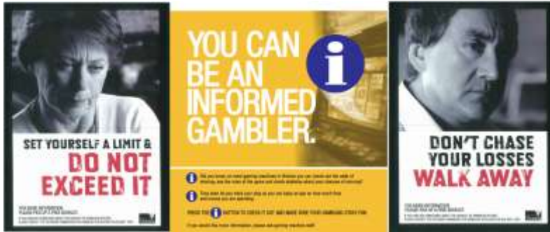
c) La disponibilità di servizi di supporto