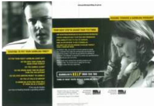
d) Il pagamento delle vincite politica